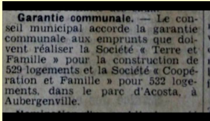
Extrait du Courrier de Mantes du 01/02/1961

Encore un projet d'urbanisme social venu de l'extérieur. La municipalité de l'époque y donnant son aval comme elle l'avait fait précédemment (Cf. Elisabethville).